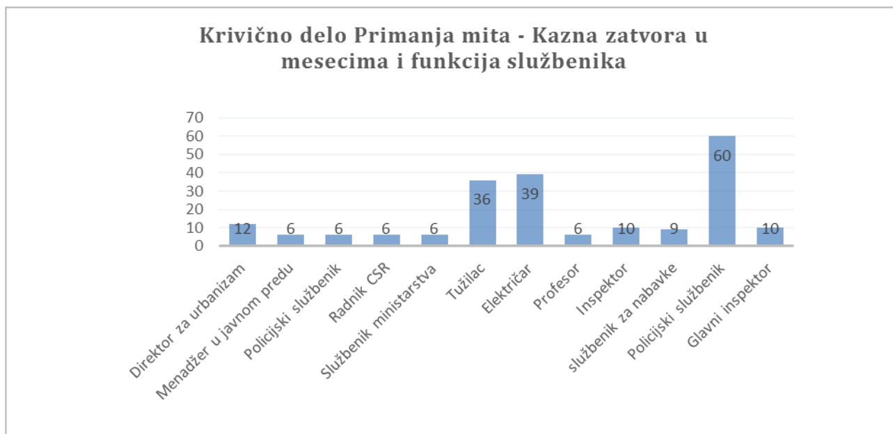
Fig. br. 10

Kao što se može videti u tabelu iznad, kazne u prvostepenom sudu variraju između 6-60 meseci i uključuju okrivljene na različitim nivoima dužnosti i upravljanja. Međutim, u listi ispod su listirane iste kazne, ali sa širim objašnjenjem slučaja: